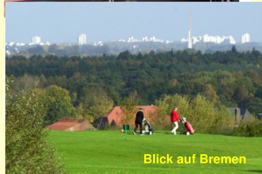
Blick auf Bremen